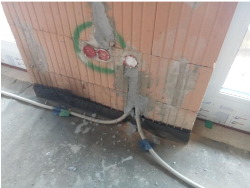
Alles verlegt und freigegeben. Jetzt kann der Putzer aber wirklich kommen!