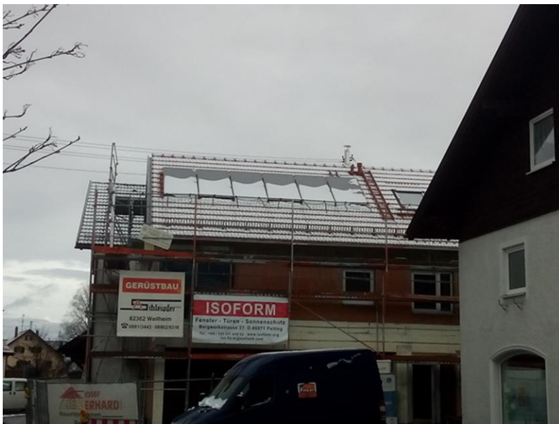
Die Solarthermie-Paneele sind auf dem Stiegler-Haus installiert. Sie helfen uns in der wärmeren Jahreszeit den Pellet-Verbrauch auf sehr, sehr geringe Mengen zu reduzieren, weil das Warmwasser dann über diese Solarkollektoren erwärmt wird.

So, das war's schon von der immer noch winterlichen Baustelle. Das nächste Mal wahrscheinlich schon im Frühjahrs-Outfit.