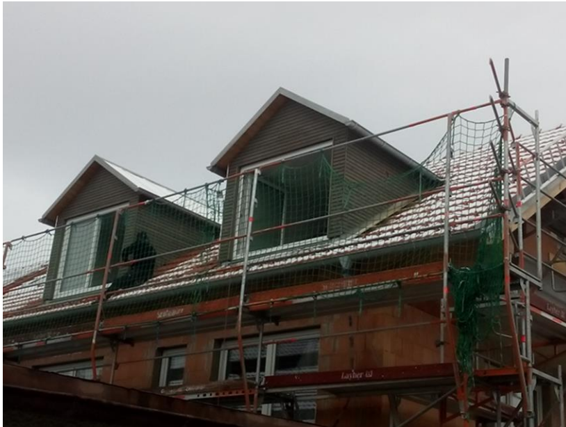
Die Dachgauben bekommen die Schalung.