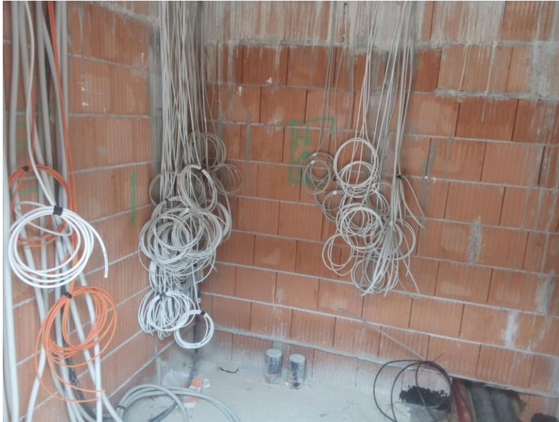
Blick in den Elektroraum. Wüsste man nicht, dass es Kabel sind, könnte man es für umgedrehte Büsche in Blüte halten.